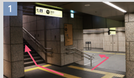
1 「11番出口」より地上へ進みます。 (手前の階段 / 奥のエスカレーター)