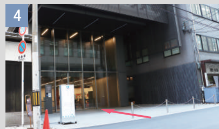
4 左手に看板のあるビルがクリニックです。エレベーターで4階総合受付へお越しください。