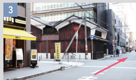
3 左側にドトールコーヒーが見えたら、最後の十字路を越えます。